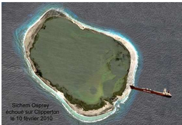
Sichem Osprey échoué sur Clipperton le 10 février 2010